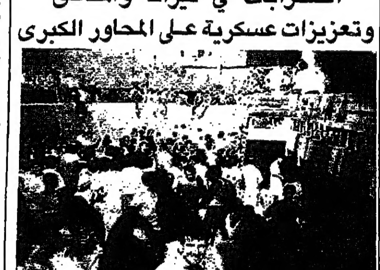
صورة للجنود البانين في سفارة ايطاليا الغربية في تيرانا

اعلنت البانيا المزيد من التغييرات الوزارية امس، بينما تسعدت اول مجموعة من اللاجئين الاميركيين الذين لجأوا الى سفارات دول اجنبية في العاصمة تيرانا ويتردد عنهم بنحو ١٠٠٠ شخص وكالة الانباء الابنانية وقالت وكالة الانباء الابنانية الرسمية، التي تستقبل تشرية في فيينا، انه تم تغيير الوزراء الاربعة المسؤولين عن الشؤون الاقتصادية والصناعية العسكرية. واكد القرار في الختام، ان المؤتمر يرفض زرع الصفة السياسية من القوات المسلحة، واطل على ما يمكن اعتباره طريقة لاختلال التعددية في صفوف الجيش انه يجب ان توضع اوليات عمل الأنشطة لمنظمات الحزب الشيوعي السوفياتي في صفوف الجيش لاقامة تنسيق بينه وبين الأنشطة الاقتصادية الاخرى العاملة في اطار القوانين السوفياتية. على صعيد اخر واجه الرئيس السوفياتي ميخائيل غورباتشوف مقاومة لسياسته الإصلاحية من جانب قطاعات مهمة من العمل السوفياتي امس، مع دخول مؤتمر الحزب اسبوعه الثاني والاخير. والم يظهر عمل منجم الفحم الذين يطالبون باستقالة الحكومة اي علامات على الاكترت بدعوتها الى الفاض اضراب العمل لمدة يوم واحد، ويعتزمون القيام به يوم الاربعاء وهو اليوم السابق للموعود المقرر لاختتام أعمال المؤتمر. واشارت تقارير صحافية عن اجتماع غورباتشوف مع مندوبي العمال والفلاحين في مطلع الاسبوع، ان وجود مخاوف من المزارع والمصانع من اصلاحاته المقترحة خاصة التحول الى اقتصاد السوق. ويتم عمل المناجم الحكومية ببطء عن اوفياء بوعود تحسين مستويات معيشتهم، وهي الوعود التي ائتت اضرابات بالمناجم منذ عام ١٩٨٥. واشنطن - ا ف ب